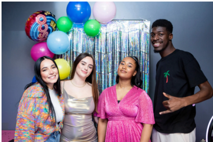
Soirée disco organisé par la maison Pi 19 février 2024