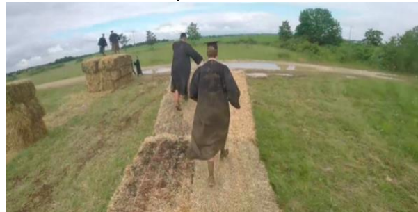
Ruée des fadas 25 septembre 2022