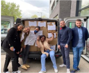
Convoi de denrées pour l'Ukraine 30 mars 2022