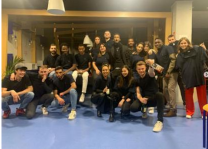
Soirée olympiades par Omicron 11 mars 2022