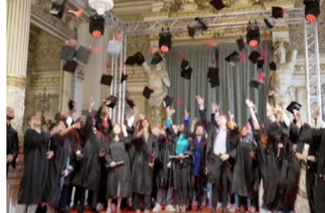
Gala remise des diplômes 19 mars 2022